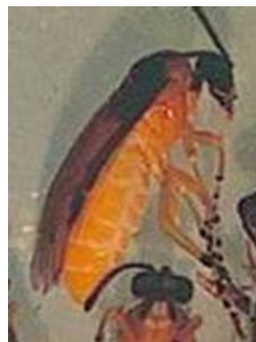
Adulte tenthrède de la rave.