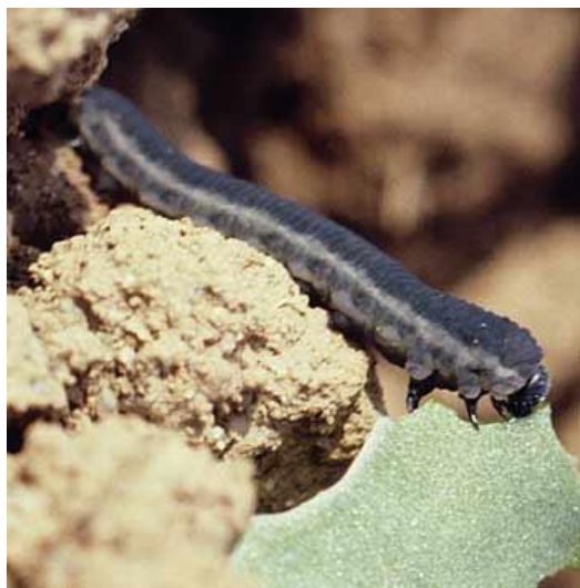
Larve de tenthrède.

Rappelons que cet insecte adulte n'est pas nuisible pour le colza. En revanche, les larves peuvent occasionnellement se révéler nuisibles lorsqu'elles prélèvent pour leur alimentation plus de 25% de la surface foliaire jusqu'au stade 6 feuilles. La gestion de ce ravageur par la chimie est rarement nécessaire. Rappelons que les traitements inutiles favorisent les pucerons résistants aux pyréthrinoides et les transmissions de viroses.