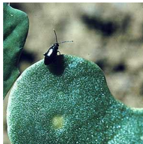
Petite altise