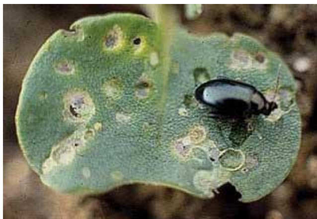
Grosse altise

Surveiller attentivement les colzas jusqu'au stade 3 feuilles, en observant prioritairement les bordures de parcelles. Le seuil de nuisibilité est de 80% de plantes avec morsure ou de ¼ de surface foliaire détruite pour ces deux ravageurs.